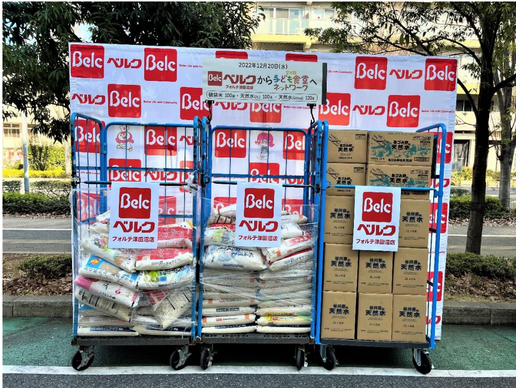
ベルクフォルテ津田沼店に集められたお米(100袋)と水(約220本)

寄付用途: 12月21日(木)~12月24日(日)に各子ども食堂にてお子さまがいる支援が必要な世帯を対象に「フードパントリー(食品の無料配布)」として活用されます。