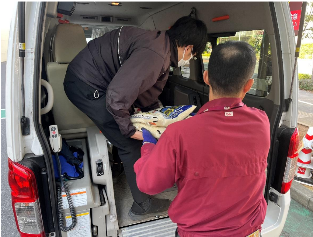
寄付したお米がベルク フォルテ津田沼店から運ばれる様子