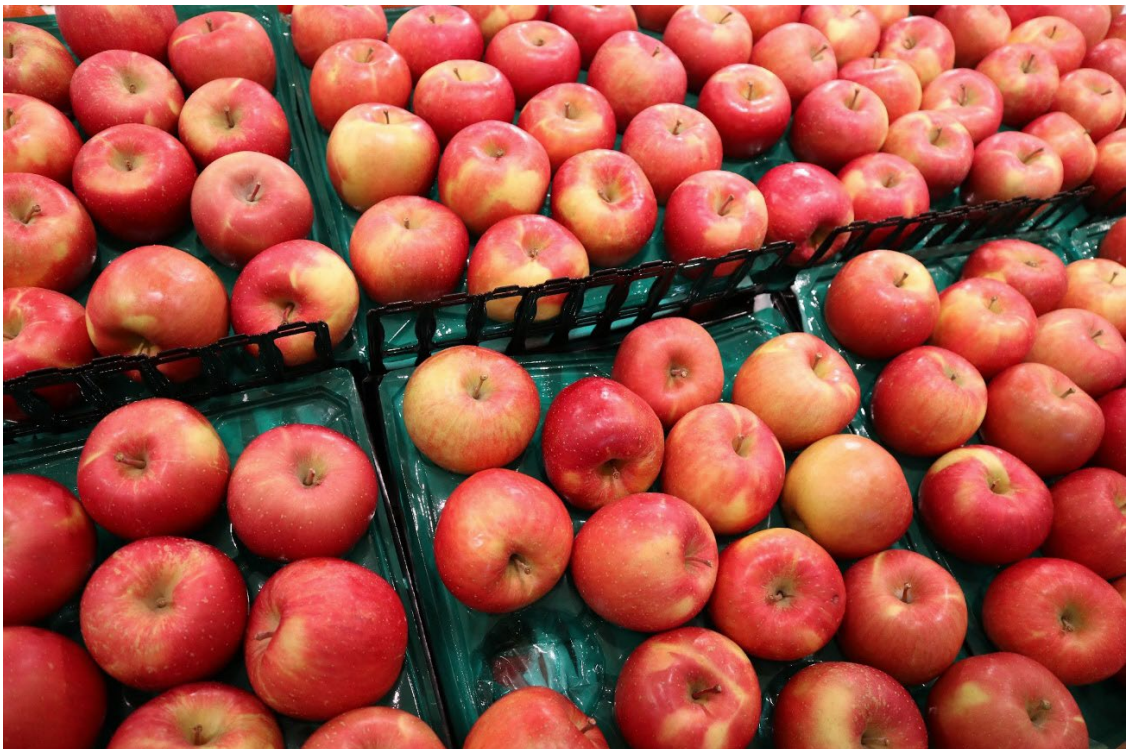
期間中はりんごなどの青森県産商品がベルク店頭に並びます