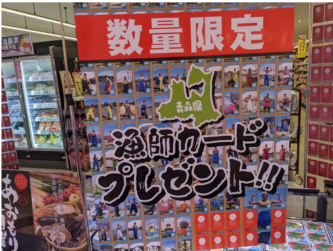
ベルク和光白子店では数量限定で話題の漁師カードプレゼント