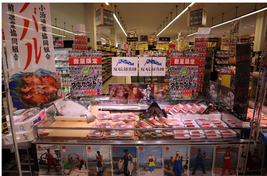
過去開催時のベルク店頭の様子

和光白子店ではミスりんごあおもりやミス・クリーンライスが県産食材を PR また地元漁師とのチェキ会などのイベントも開催