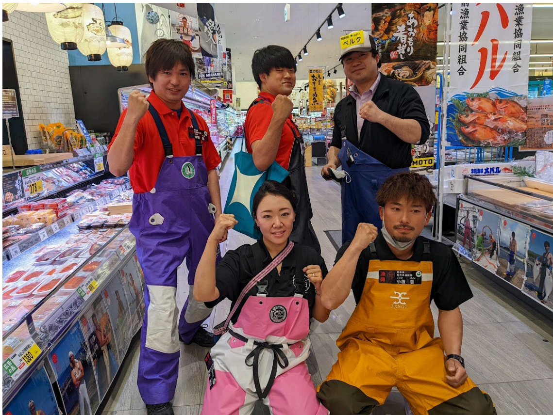
ベルク和光白子店では地元漁師とのチェキ会も開催